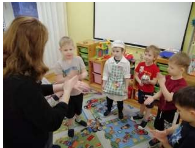
Чтение «Горшочек каши»