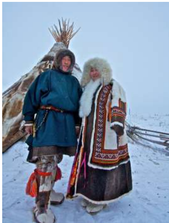
Рис. 2, 3