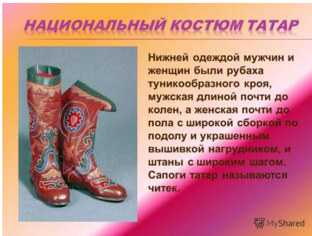
Рис 42. Орнамент