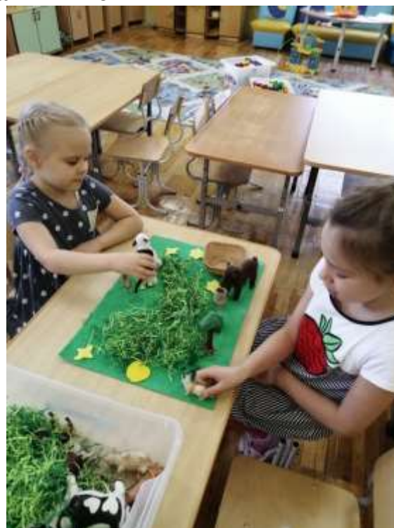
Сказка народов ханты «Мышка»