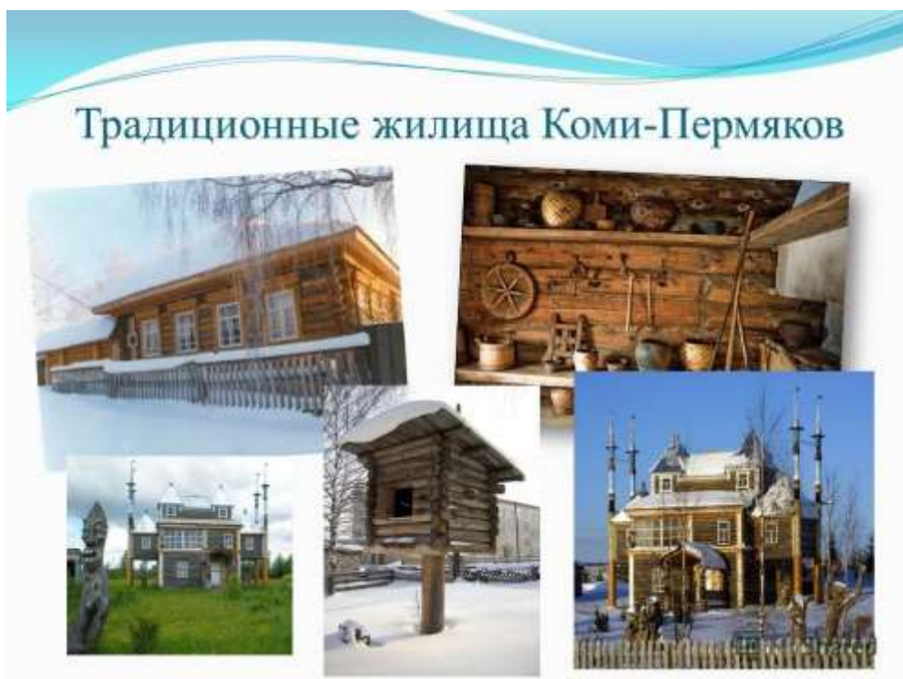
Рис 46. Дом