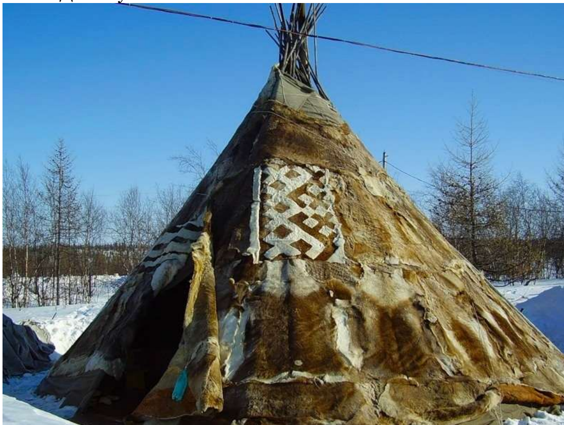
Рис. 1. Дом-Чум