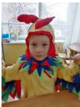
Рис 11. Петух-Глеб З.